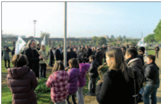
Abitare a Roma - 29/11/2011